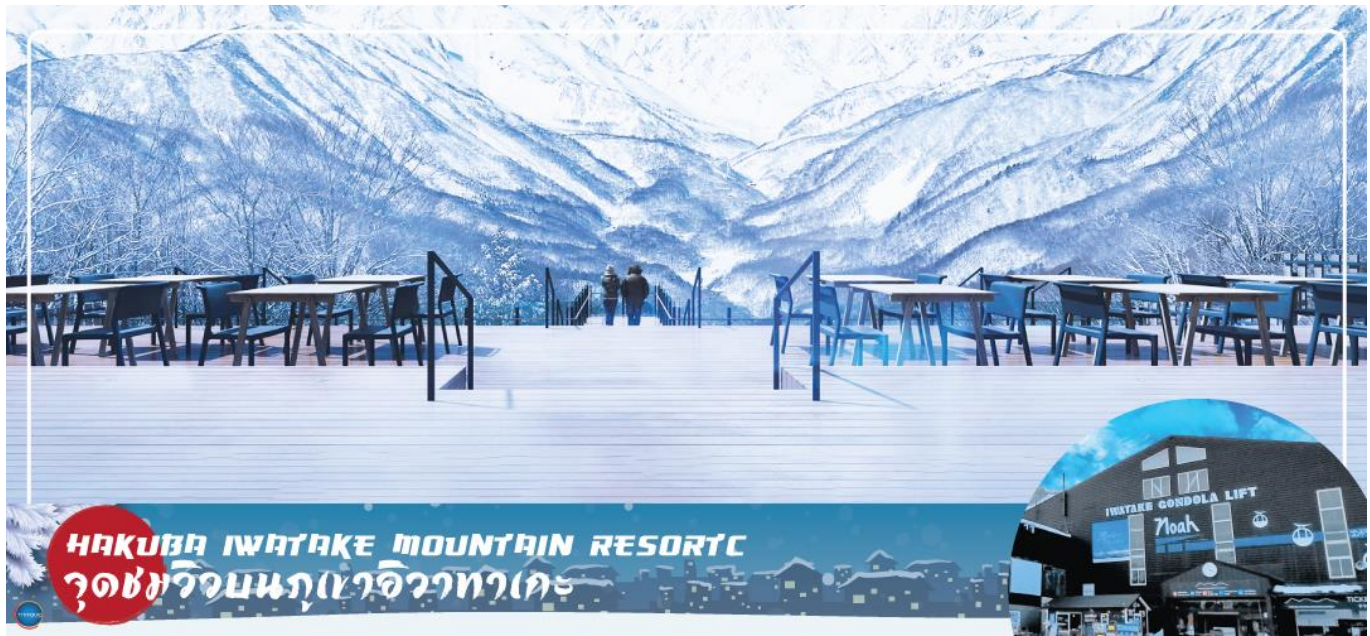
HAKUBA IWATAKE MOUNTAIN RESORT จุดชมวิวบนภูเขาวีวาทาเกะ

เมืองมัตสึโมโตะ – เมืองนากาโนะ – ฮาคุบะ – HAKUBA IWATAKE MOUNTAIN RESORT (คอนโดล่า ลิฟท์) – ไร่ชาซาบิไดโอะ – เมืองยามานาชิ – หมู่บ้านโอชิโนะสั๊กไก – ออนเซ็น + ชาบูยักษ์