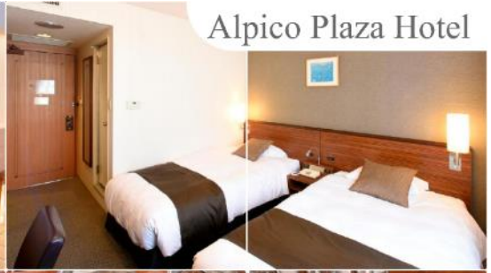
Alpico Plaza Hotel