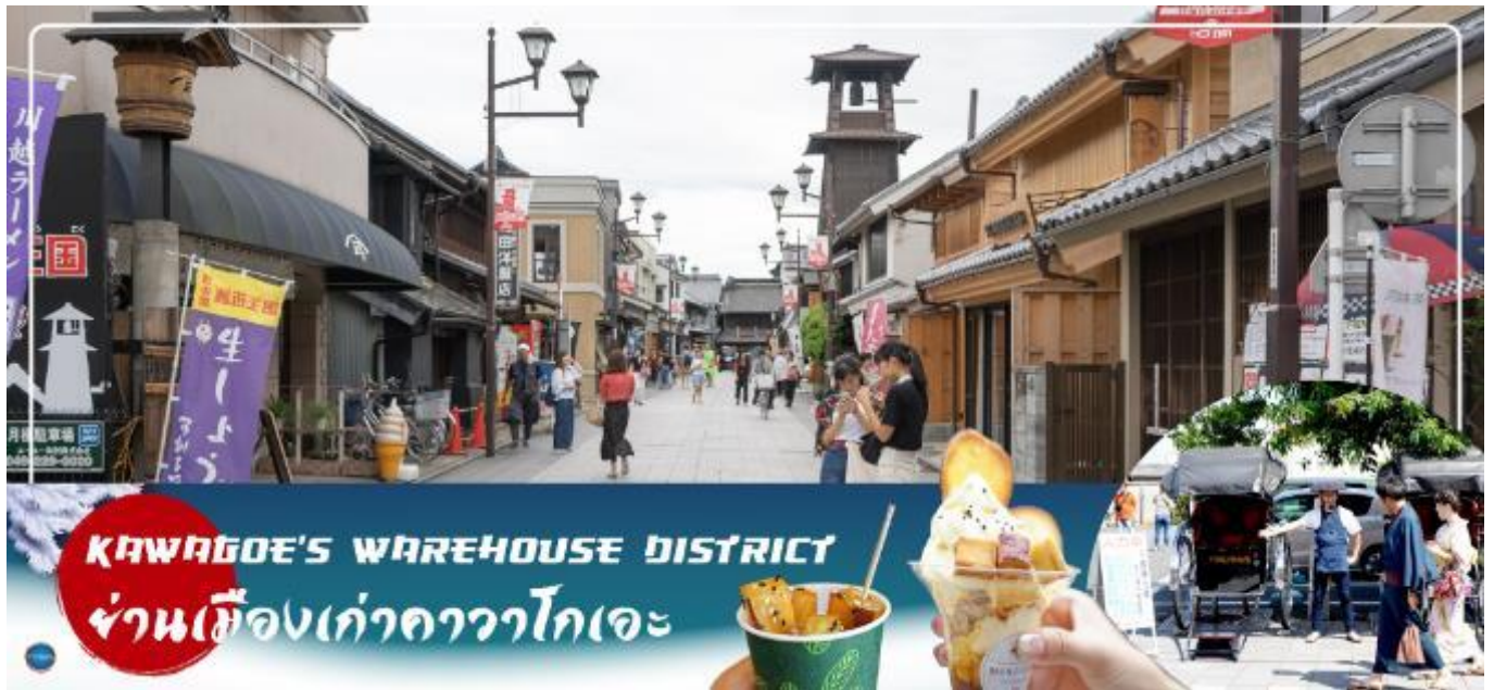
KAWAGOE'S WAREHOUSE DISTRICT ย่านเมืองเก่าคาวาโกเอะ

วันที่สี่ กรุงโตเกียว – จังหวัดไซตามะ – ย่านเมืองเก่าคาวาโกเอะ – กรุงโตเกียว – ชมแมวยักษ์ 3 มิติ พร้อมช้อปปิ้ง ย่านชินจูกุ