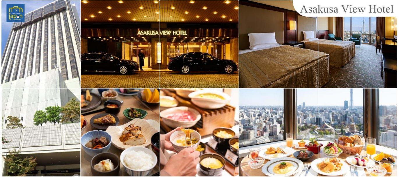
Asakusa View Hotel

วันที่สี่ กรุงโตเกียว – จังหวัดไซตามะ – ย่านเมืองเก่าคาวาโกเอะ – กรุงโตเกียว – ชมแมวยักษ์ 3 มิติ พร้อมช้อปปิ้ง ย่านชินจูกุ