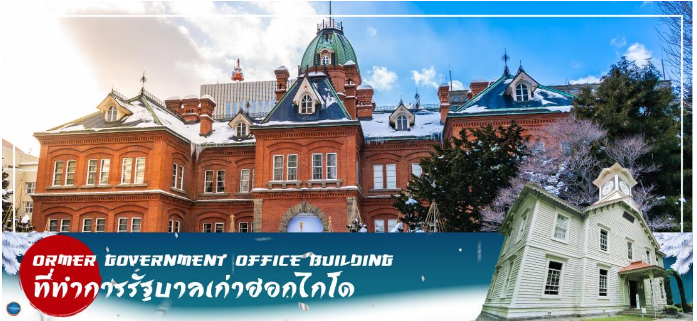
FORMER GOVERNMENT OFFICE BUILDING ที่ทำการรัฐบาลเก่าฮอกไกโด

เที่ยง รับประทานอาหารกลางวัน ณ ภัตตาคาร (6)