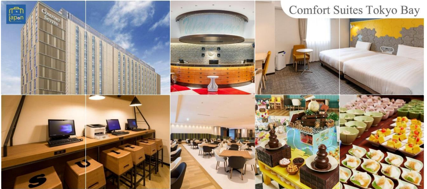
Comfort Suites Tokyo Bay

พักที่ COMFORT SUITES TOKYO BAY หรือเทียบเท่าระดับเดียวกัน