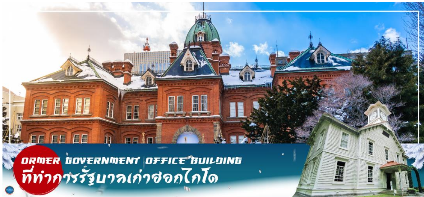
FORMER GOVERNMENT OFFICE BUILDING ที่ทำการรัฐบาลเก่าซอกไกโด

วันที่สี่ เมืองซัปโปโร – ดิวตี้ฟรี – ผ่านชม ศาลว่าการเมืองซอกไกโดหลังเก่า – ผ่านชม หอนาฬิกาเมืองซัปโปโร – เมืองอาซาฮิคาว่า – โซยุเคียว – ภูเขาคุโรดาเกะ (นั่งกระเช้า)** ขึ้นอยู่กับสภาพอากาศ** – ออนเซน