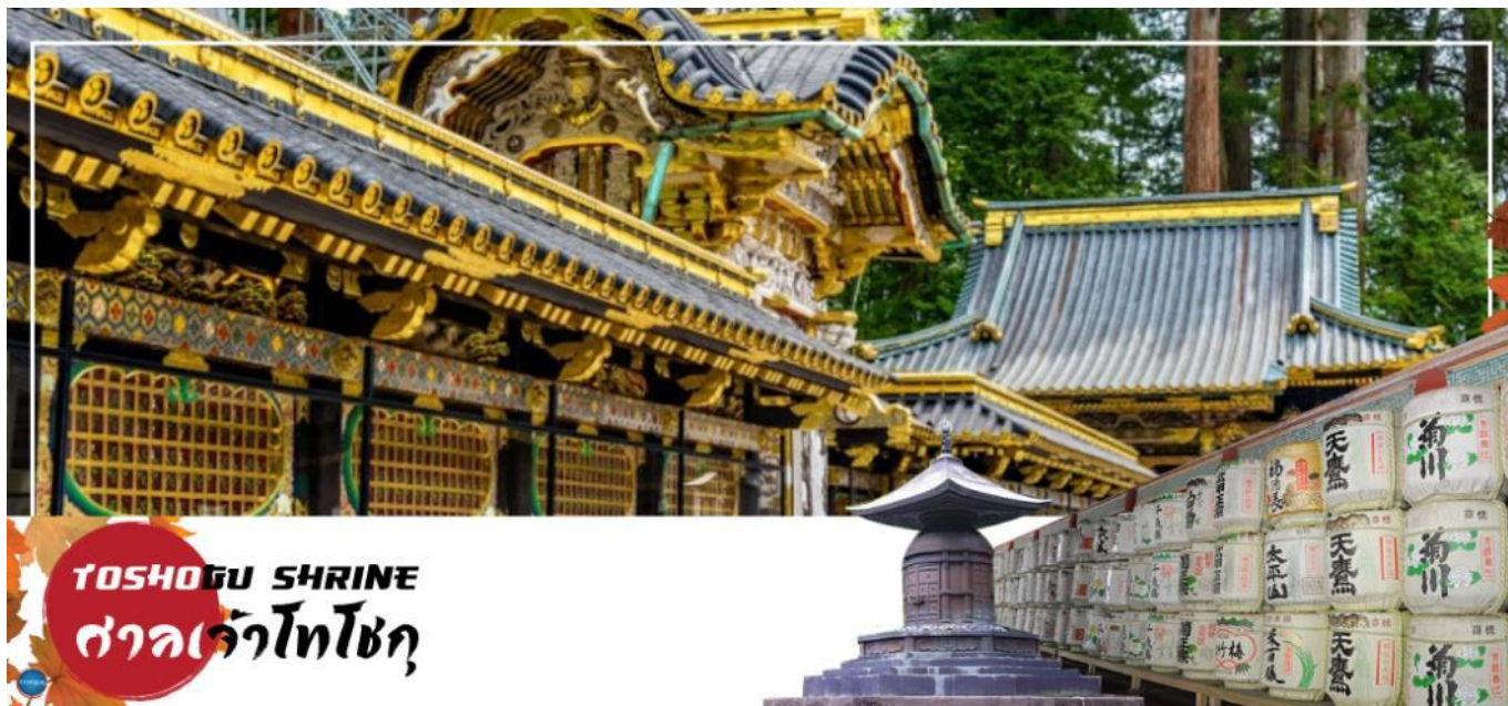
TOSHOGU SHRINE ศาลเจ้าโทโชกุ

วันที่สาม เมืองนิกโกะ – ผ่านชม สะพานชินเคียว – ศาลเจ้าโทโชกุ – ศาลเจ้าฟูตาระ – จังหวัดไซตามะ – ย่านเมืองเก่าคาวะโกเอะ – ดรอกลูกกวาด – เมืองยามานาชิ – ออนเซ็น + ชาบูยักษ์