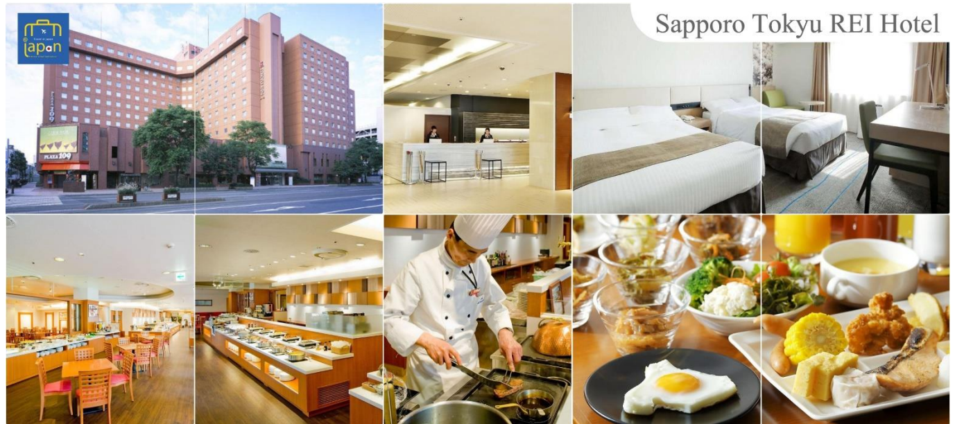
Sapporo Tokyu Rei Hotel

รับประทานอาหารเย็น ณ ภัตตาคาร (7) --- พิเศษ!!! เมนู ชาบู + ชาปู SAPPORO TOKYU REI HOTEL หรือเทียบเท่าระดับเดียวกัน