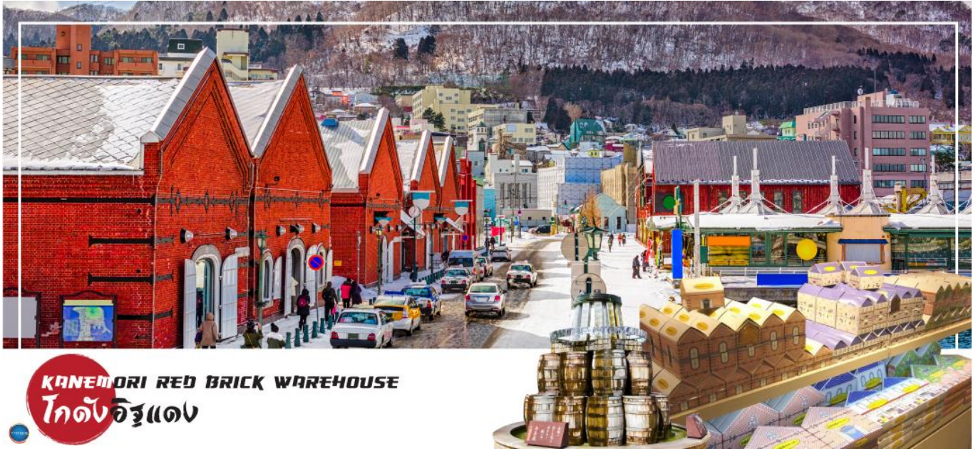
KANEMORI RED BRICK WAREHOUSE โกดังอิฐแดง

วันที่สาม เมืองฮาโกดาเตะ – โกดังอิฐแดง – ย่านเมืองเก่าโมโตมาชิ – ป้อมโกเรียวคาค (เข้าชม) – อุทยานแห่งชาติทะเลสาบโอนุมะ – ทะเลสาบโทยะ – ออนเซน