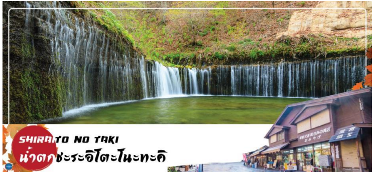
SHIRAITO NO TAKI น้ำตกชิระอิโตะโนะตะคิ

เมื่อวันที่ 22 มิถุนายน ค.ศ.2013 น้ำตกชิราอิโตะถือเป็นน้ำตกที่ศักดิ์สิทธิ์ มีศาลเจ้าอาชามะตั้งอยู่ด้วยการไหลของสายน้ำที่แยกสายออกเป็นหลากรอยเส้น ทำให้มองดูแล้วเหมือนกับเส้นด้ายสีขาว จึงเป็นที่มาของชื่อเรียกที่ว่า ชิราอิโตะ ที่แปลตรงตัวว่า ด้ายสีขาว นั่นเอง อีกทั้งที่นี่ยังมีเรื่องราวของ