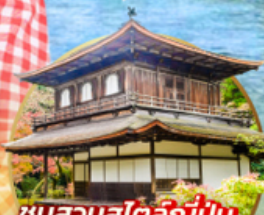
ชมสวนสไตล์ญี่ปุ่น.. Ginkakuji Temple