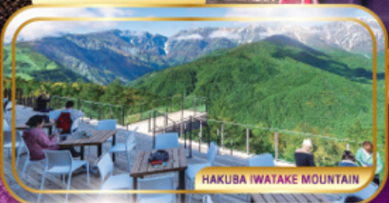
HAKUBA IWATAKE MOUNTAIN