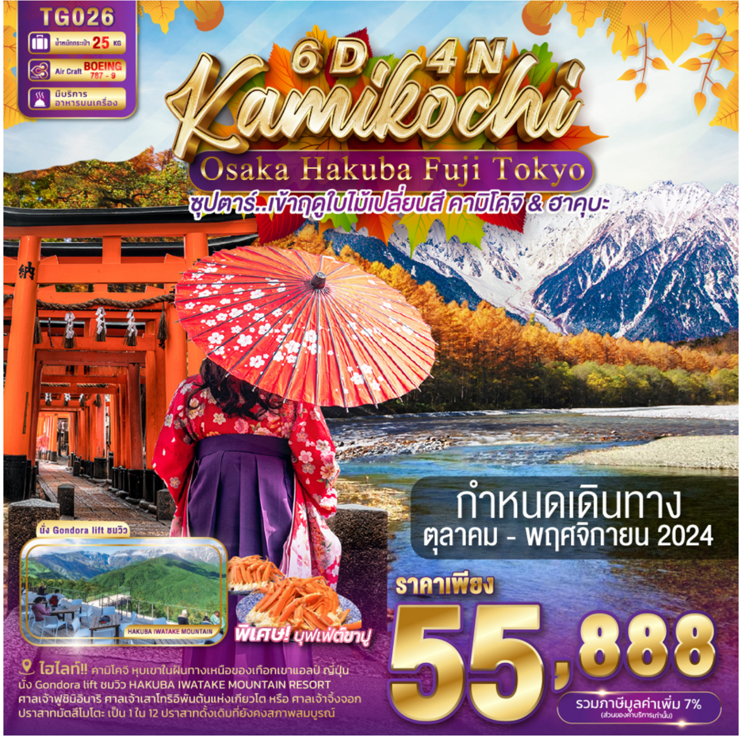
นั่ง Gondora lift ชมวิว

ชูปตาร์..เข้าฤดูใบไม้เปลี่ยนสี คาชิโคจิ & ฮาคูบะ