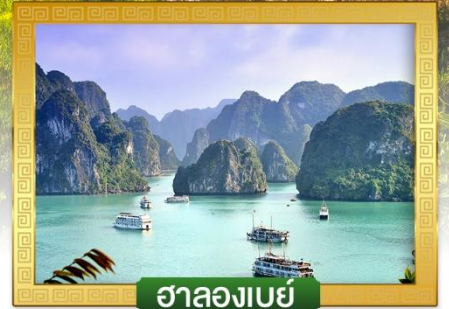
ฮาลองเบย์