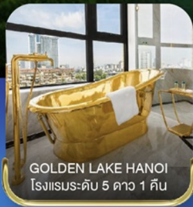
GOLDEN LAKE HANOI โรงแรมระดับ 5 ดาว 1 คืน