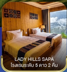
LADY HILLS SAPA โรงแรมระดับ 5 ดาว 2 คืน