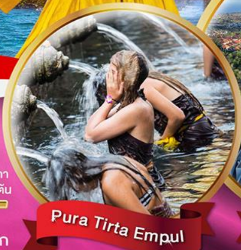
Pura Tirta Empul

วัดอูลูวาตู วิหารทานาคะลอต วัดบราตัน ไชว์ระบำเกอจิก วัดทามันอายุน หมู่บ้านคินตามณี ชมภูเขาไฟบาตอร์ ความพิเศษสุด ชมวัฒนธรรมศิลปะพื้นเมืองดีดี ร้านอาหาร