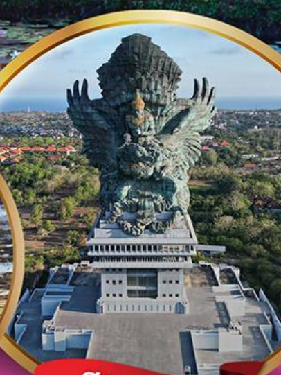
สวนวิษณุ