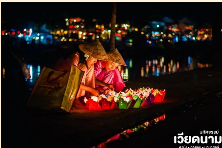
เวียดนาม มัทจอร์รี่ คาบัง • ฮอยอัน • บานาฮิลล์

นำท่าน ล่องเรือลอยกระทง ในแม่น้ำหว่าย และเพลิดเพลินไปกับทิวทัศน์ของเมืองโบราณฮอยอันในยามค่ำ ค่ำคืนที่ส่องแสงระยิบระยับด้วยแสงไฟ