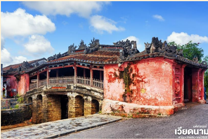
เวียดนาม มัทจอร์รี่ คาบัง • ฮอยอัน • บานาฮิลล์

เหวียนไทฮ็อกทำเป็นร้านบูติก ด้านหลังติดถนนอีกสายหนึ่งใกล้แม่น้ำทูโบนมีประตูออกไม้ สามารถชมวิวทิวทัศน์และเห็นเรือพายสัญจรไปมาในแม่น้ำทูโบนได้เป็นอย่างดี นำชม สะพานญี่ปุ่น ซึ่งสร้างโดยชุมชนชาวญี่ปุ่นเมื่อ 400 กว่าปีมาแล้ว กลางสะพานมีศาลเจ้าศักดิ์สิทธิ์ ที่สร้างขึ้นเพื่อสวดส่งวิญญาณมังกร ชาวญี่ปุ่นเชื่อว่า มีมังกรอยู่ใต้พิภพส่วนตัวอยู่ที่อินเดียและหางอยู่ที่ญี่ปุ่น ส่วนลำตัวอยู่ที่เวียดนาม เมื่อใดที่มังกรพลิกตัวจะเกิดน้ำท่วมหรือแผ่นดินไหว ชาวญี่ปุ่นจึงสร้างสะพานนี้โดยตอกเสาเข็มลงกลางลำตัวเพื่อกำจัดมันจะได้ไม่เกิดภัยพิบัติขึ้นอีก ชม ศาลกวนอู ซึ่งอยู่บนสะพาน ญี่ปุ่นและที่ฮอยอันชาวบ้านจะนำสินค้าต่าง ๆ ไว้ที่หน้าบ้าน เพื่อขายให้แก่นักท่องเที่ยวท่านสามารถซื้อของที่ระลึก เป็นของฝากกลับบ้านได้อีกด้วย เช่น กระเป๋าโคมไฟ เป็นต้น