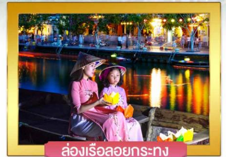
ล่องเรือลอยกระทง