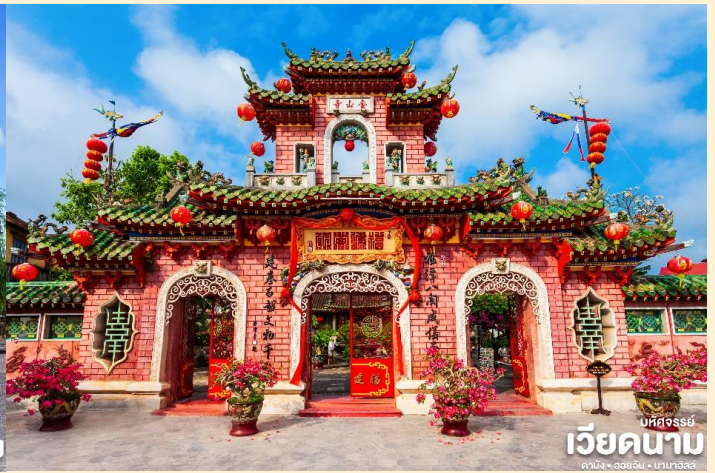
เวียดนาม มัทจอร์รี่ คาบัง • ฮอยอัน • บานาฮิลล์

นำท่าน ล่องเรือลอยกระทง ในแม่น้ำหว่าย และเพลิดเพลินไปกับทิวทัศน์ของเมืองโบราณฮอยอันในยามค่ำ ค่ำคืนที่ส่องแสงระยิบระยับด้วยแสงไฟ