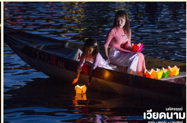
เวียดนาม มัทจอร์รี่ คาบัง • ฮอยอัน • บานาฮิลล์