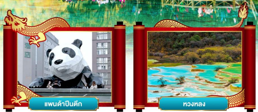
แพนด้าปิ่นตึก