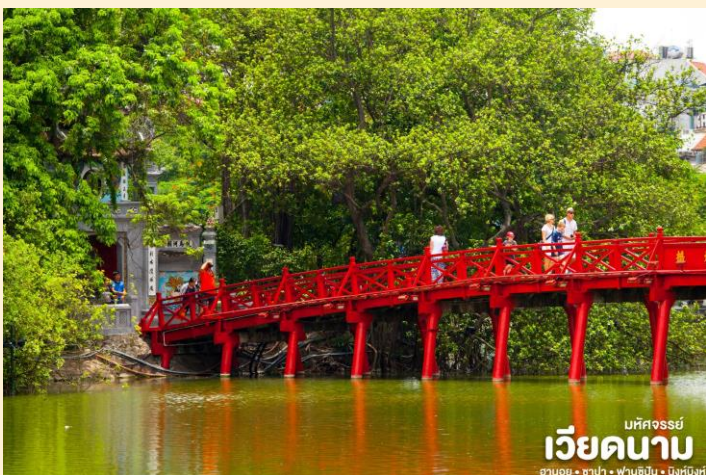
มณฑลจอร์เจีย เวียดนาม ฮานอย • ซาปา • ฟานซิง • นิงห์ฮิงห์