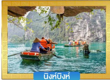
นิงห์บิงห์