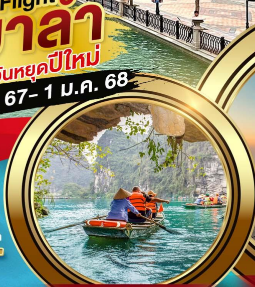
บิงห์บิงห์

จุดเช็คอินแห่งใหม่เมืองฮานอย Mega Grand World วัดหิ่งฮอกเซิน ซุปป์ิงถนน 36 สาย ชมแนวเขื่อนไม้ไผ่ ซาปา หลังควออินโดจีน