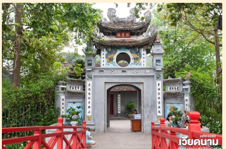
มณฑลจอร์เจีย เวียดนาม ฮานอย • ซาปา • ฟานซิง • นิงห์ฮิงห์

จากนั้น นำท่านชม สะพานแสงอาทิตย์ สีแดงสดใสสู่กลางทะเลสาบคืนดาบ ชมวัดโบราณ วัดหังอกเซิน (ด้านนอก) สถานที่แห่งนี้มี เต่าสตัฟ ขนาดใหญ่ ซึ่งมีความเชื่อว่า เต่าตัวนี้ คือเต่าศักดิ์สิทธิ์ 1 ใน 2 ตัวที่อาศัยอยู่ในทะเลสาบแห่งนี้มาเป็นเวลานาน