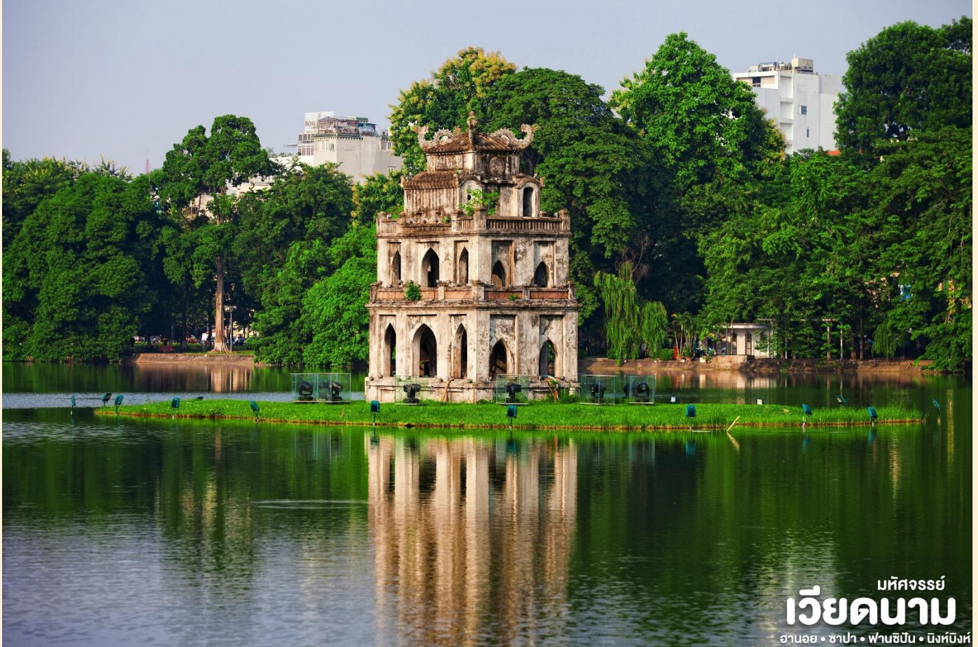
มณฑลจอร์เจีย เวียดนาม ฮานอย • ซาปา • ฟานซิง • นิงห์ฮิงห์