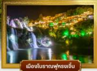
เมืองโบราณฟุหรงเจิน