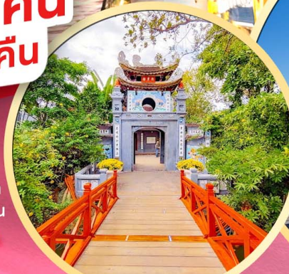
วัดหังอกเซิน