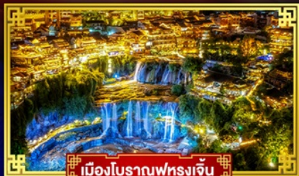
เมืองโบราณฟุรงเจิน

เที่ยว 2 เมืองโบราณ ทะลุขมเมืองใหม่ : "ICE & SNOW WORLD"