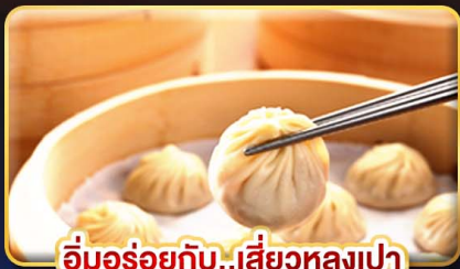
อึ้งอร่อยกับ..เสี่ยวหลงเปา

พิเศษ !! หม้อนึ่งจักรสวรรค์ ,ไอศกรีม MIYAHARA