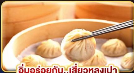
อู่มอร่อยกับ..เสี่ยวหลงเปา

พิเศษ !! หม้อนึ่งจิวสวรดี้ ,ไอศกรีม MIYAHARA