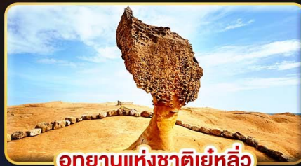
อุทยานแห่งชาติยี่หลิว