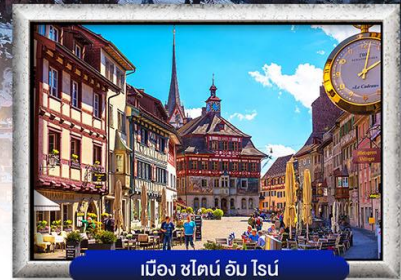
เมือง ชไตน์ อัม ไสน์