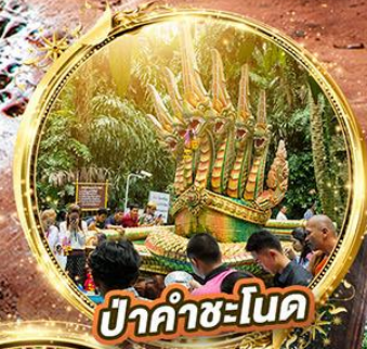
ป่าค่าชะโนด