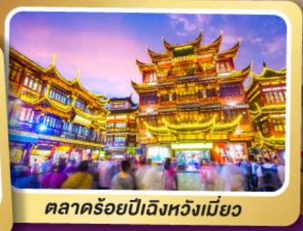
ตลาดร้อยปีเจิ้งหวังเมี่ยว

สนุกสุดมันส์ไปกับเครื่องเล่น Shanghai Disneyland เต็มวัน