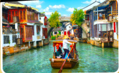
เมืองโบราณจู่เจียเจียว