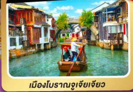
เมืองโบราณซูโจวเจียว