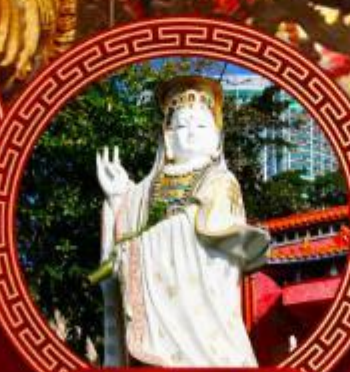
เจ้าแม่กวนอิม รีพัลส์เบย์