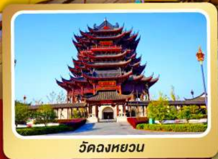
วัดฉางหวง