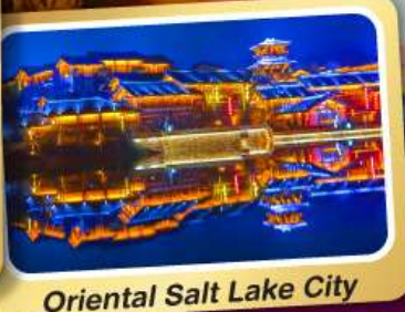
Oriental Salt Lake City