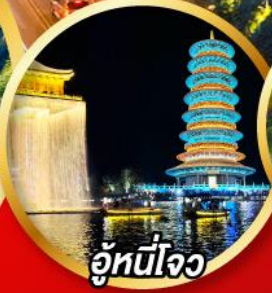
อู้หนี่ใจ