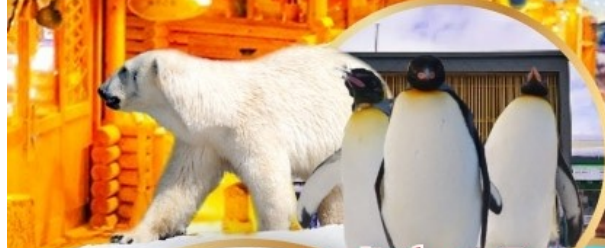
สวนสัตว์อาซาฮิกาวะ