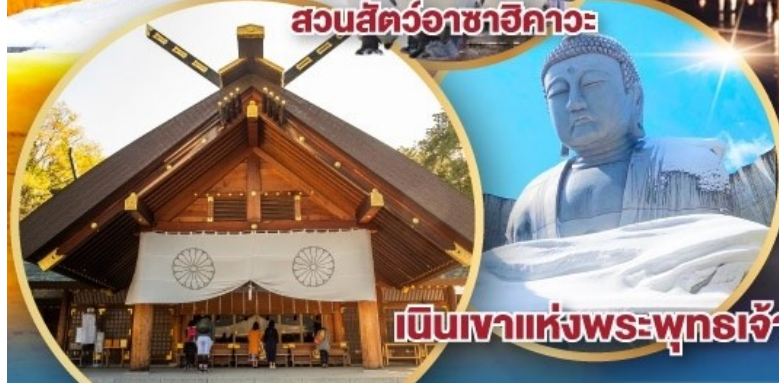
เป็นเขาแห่งพระพุทธรเจ้า