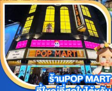
ร้านPOP MART ที่ใหญ่ที่สุดในโลก