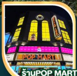
ร้าน POP MART ที่ใหญ่ที่สุดในไต้หวัน