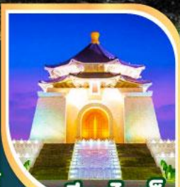
เจียงไคเช็ค