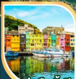
ท่าเรือเจิ้งปิ่น