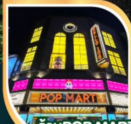
ร้านPOP MART ที่ใหญ่ที่สุดในไต้หวัน