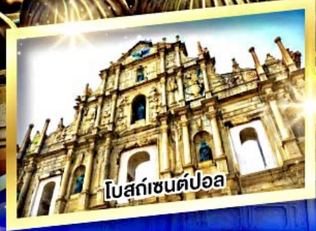
โบสถ์เซนต์ปอล

เมนูพิเศษ ห่านย่าง, ต้มข้าวฮ่องกง, บุฟเฟ่ต์สไตล์ฮ่องกง