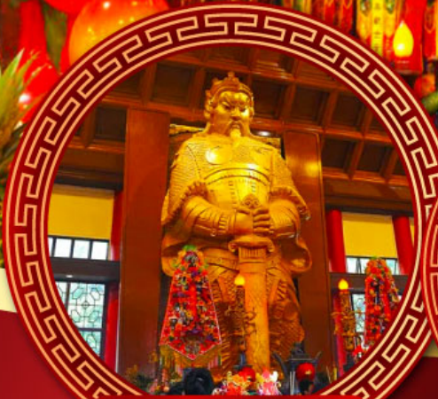
วัดแขกหมิว