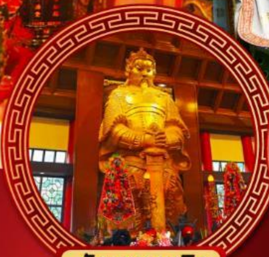
วัดเขกหมิว