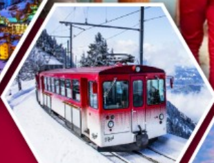
รถไฟใต้เขาริกิ