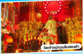
วัดเจ้าแม่กวนอิมของงำ

*นั่งรถข้ามสะพานเซ็นเจิ้น-จงซาน "สะพานข้ามทะเลที่สูงที่สุดในโลก"