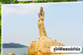
จูไห่โพซอร์เกิร์ส