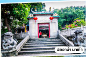
วัดอามา มาเก๊า