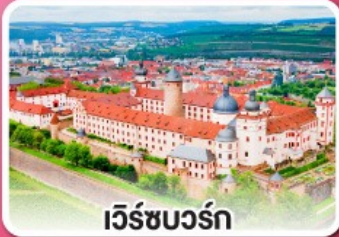
เว็ร์ชบวร์ค