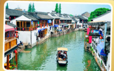
เมืองโบราณจู่เจียเจี้ยว