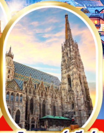
มหาวิหารเซนต์สตีเฟ่น