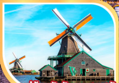
หมู่บ้านกังหันลมซานสคันส์