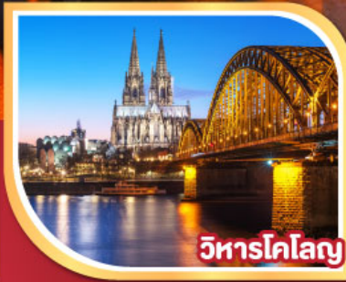
วิหารโคโลญ