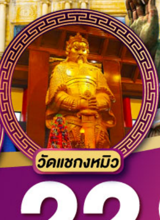
วัดชองหิว