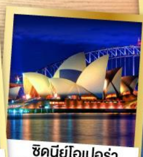
ซินนีย์โอเปอร์่า