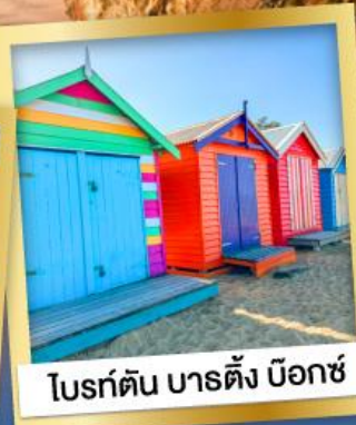
ไบรท์ตัน บาร์ดิง บ็อกซ์

03-10, 12-19 เม.ย.68 24 เม.ย.-01 พ.ค.68 08-15, 22-29 พ.ค.68 29 พ.ค.-05 มิ.ย.68