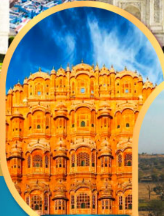
พระราชวัง สายลม