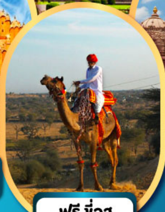
ฟรี ขี่ เมืองมันทาว