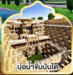
บ่อน้ำหินบันได