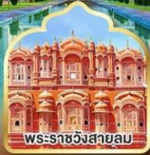
พระราชวังสายลม