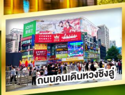
ถนนคนเดินหวงชิ่งอู๋