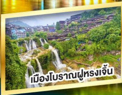
เมืองโบราณฟูรงจิ้น