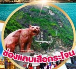
ช่องแคบเสีอกระโจน