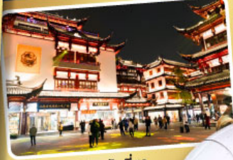
ตลาดร้อยปีเจิ้งหวงเหมียว