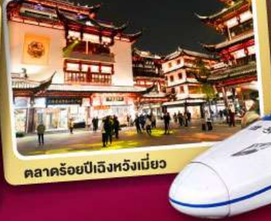
ตลาดร้อยปีเจิ้งหวิงเบียว