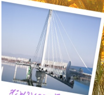
สะพานลอยฟ้า โซยองคัง