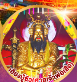
เอียงบูซิว (ศาลเจ้าพ่อเสือ)

เมนูพิเศษ!! อาหารแต่จิว 18 อย่าง ห้ามพลาด! ต้นตำรับชวงเกา สุกี้ซิว