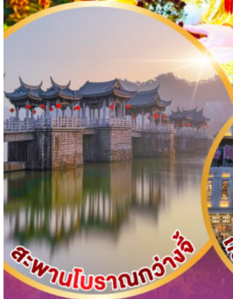
สะพานโบราณกว่างจี้