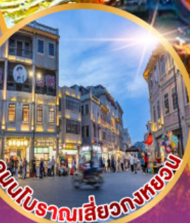
ถนนโบราณเสี่ยวกงหยง