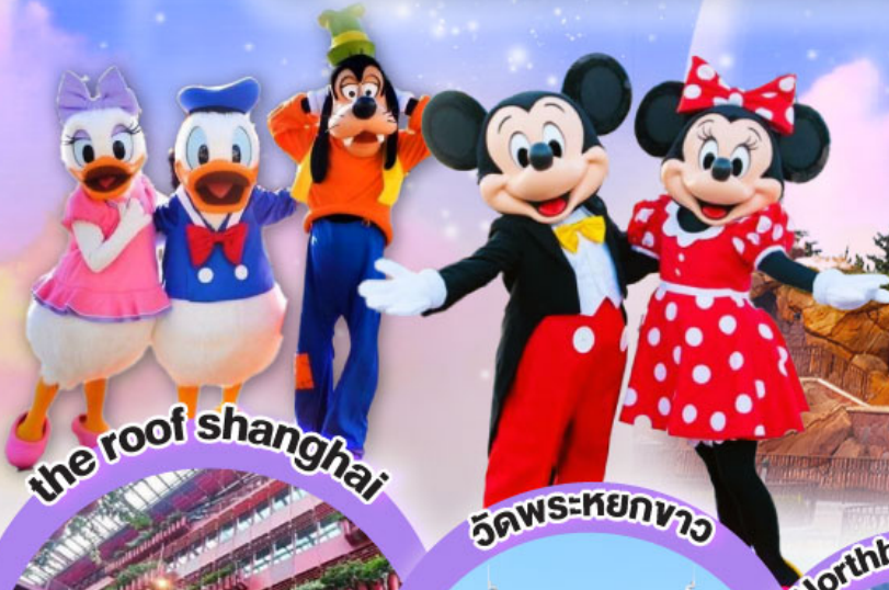
the roof shanghai