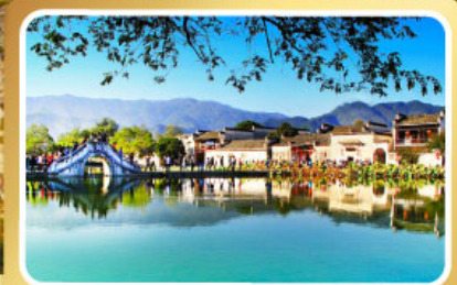
หมู่บ้านมรดกโลก หงซุน