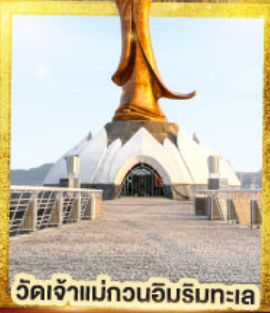
วัดเจ้าแม่กวนอิมริมทะเล