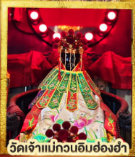
วัดเจ้าแม่กวนอิมฮ่องอ่า