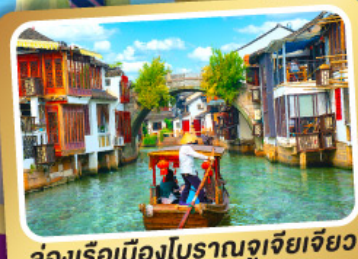
ล่องเรือเมืองโบราณซูเจียเจียว